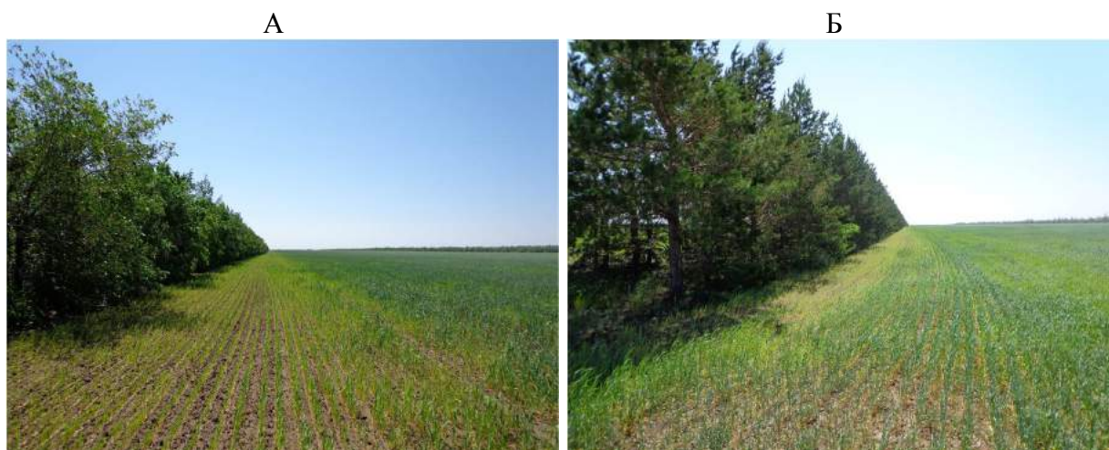
Рис. 2. Депрессионная зона агроценоза яровой пшеницы на каштановой почве Кулундинской степи (Алтайский край): А – у четырёхрядной лесной полосы из ильма, Б – у двухрядной из сосны обыкновенной. Июнь, 2013 г.

На территории засушливых областей, где питание лесных полос во многом осуществляется за счёт прилегающих полей, важнейшим лесоводственным приёмом является снижение общей потребности древостоя в запасе почвенной влаги до уровня, при котором существенно уменьшается амплитуда колебания его влагообеспеченности по годам, удовлетворительно растут и формируются устойчивые насаждения. Он реализуется путём уменьшения рядности полос, дифференцирования их породного состава в зависимости от рельефа полей, использования преимущественно засухоустойчивых видов, формирования умеренно ажурного ветроломного профиля и содержания насаждений в режиме лесных экосистем, то есть – соблюдением базовых принципов степного лесоразведения – обеспечение эффективного влагонакопления в почве, отведённой под насаждение полосы, сбережение и экономное расходование почвенной влаги. Во влагообеспеченных районах – в основном, повышением ажурности ветроломного профиля лесных полос.